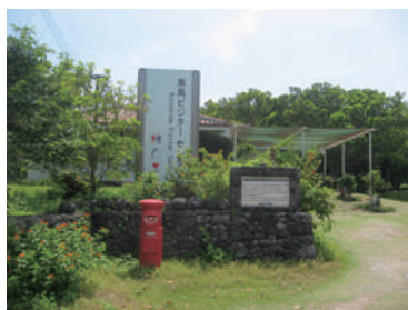
黒島ビジターセンター

物件No.149 ソフィール 物件名:黒島ビジターセンター 場所:沖縄県八重山郡竹富町 施工年月:2011年3月 人槽:48人槽 発注者:九州地方環境事務所 仕様:処理水循環