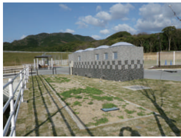
土壌浸潤槽(手前)、トイレ棟

物件No.162 ソフィール 物件名:久山町総合運動公園 Aゾーン 場所:福岡県糟屋郡久山町 施工年月:2014年9月 人槽:96人槽 発注者:福岡県 久山町役場 仕様:処理水放流