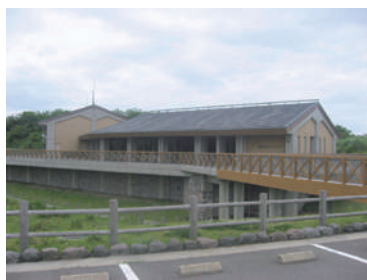
平成新山ネイチャーセンター

物件No.56 ソフィール 物件名:平成新山 ネイチャーセンター 場所:長崎県島原市 施工年月:2002年11月 人槽:132人槽 発注者:長崎県 仕様:処理水循環