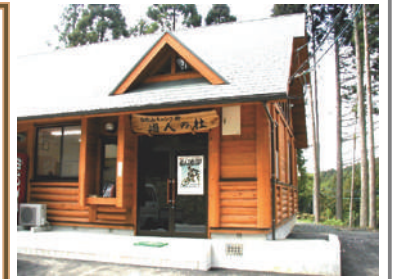
キャンプ場(管理棟)

物件No.32 ソフィール 物件名:古処山キャンプ村 「遊人の杜」 場所:福岡県嘉麻市 施工年月:2001年8月 人槽:90人槽 発注者:福岡県 嘉穂町役場 仕様:処理水放流