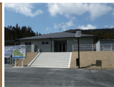
トイレ建屋と太陽電池

物件No.178 ソフィール 物件名:水上スカイヴィレッジ 「クロスカントリーコース」 場所:熊本県球磨郡水上村 施工年月:2017年3月 人槽:63人槽 発注者:熊本県 水上村役場 仕様:処理水放流