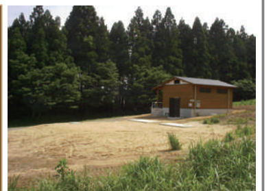
トイレ棟、処理装置

物件No.101 ソフィール 物件名:英彦山青年の家 キャンプ場 場所:福岡県添田町 施工年月:2006年4月 人槽:56人槽 発注者:福岡県 仕様:処理水循環