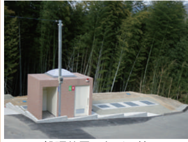
処理装置、トイレ棟

物件No.173 ソフィール 物件名:立花山登山口 場所:福岡県新宮町 施工年月:2016年3月 人槽:32人槽 発注者:福岡県 新宮町役場 仕様:処理水循環