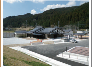
伊良原ダム道の駅「伊良とびあ館」

物件No.187 ソフィール 物件名:伊良とびあ館 場所:福岡県京都郡みやこ町 施工年月:2017年8月 人槽:166人槽 発注者:福岡県 みやこ町役場 仕様:処理水放流